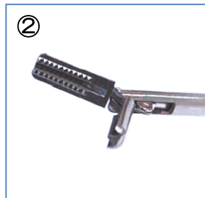
② 横開き 7mm (ドベーカー)