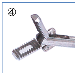
④ 縦開き 5mm (横溝・穴有)