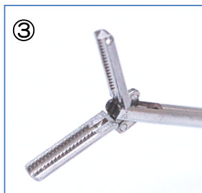
③ 縦開き 10mm (ドベーカー)