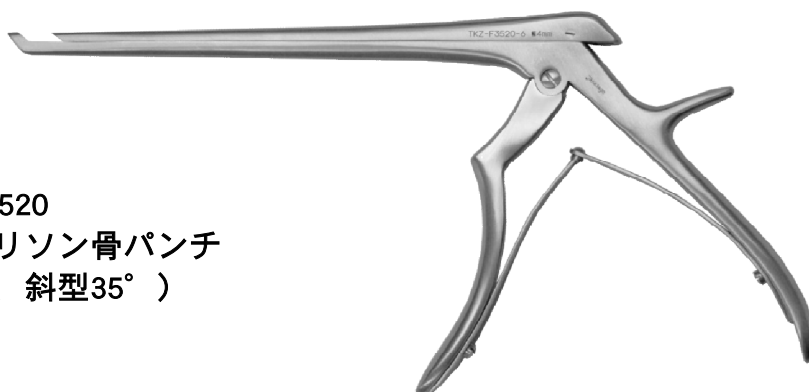
TKZ-F3520 T式ケリソン骨パンチ (上向、斜型35°)