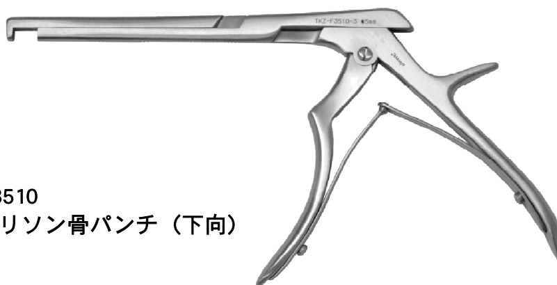
TKZ-F3510 T式ケリソン骨パンチ（下向）